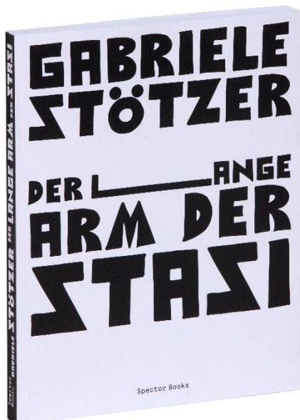
G. Stötzer: Der lange Arm der Stasi

weitere Informationen zur Ausstellung unter: www.stiftung-buchkunst.de